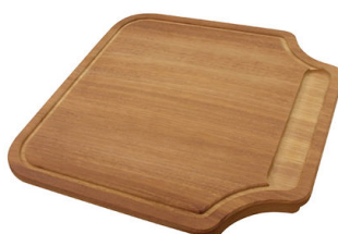
Planche de découpe en bois Iroko 8646 000