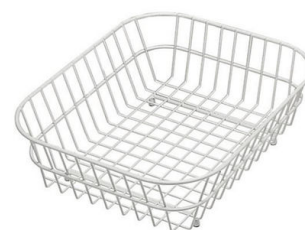
Panier en acier inoxydable 8612 000

* uniquement en combinaison avec l'accessoire 8644 101