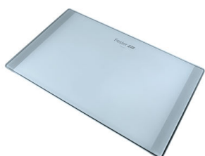
Planche de découpe en verre 8633 300